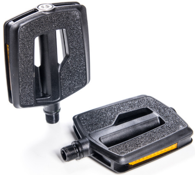
Urban Pedale, City/Trekking City Pedale, City/Trekking